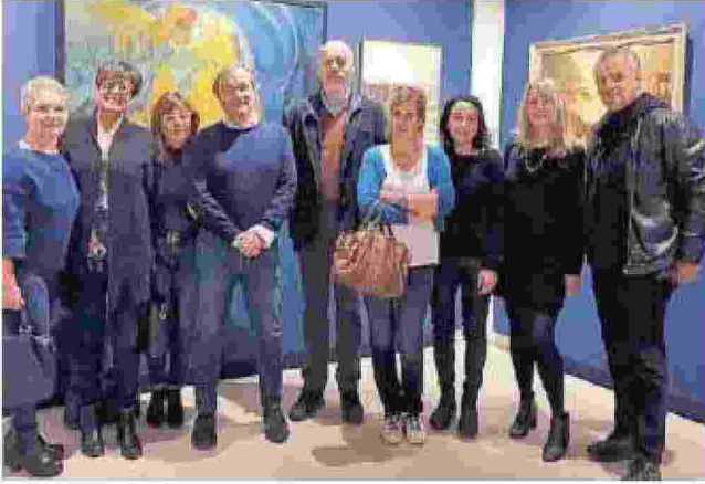
Il gruppo degli abbonati a Noi Tirreno ieri alla mostra a Pontedera

PONTEDERA. Una interessante e ricca mostra che racconta attraverso varie forme artistiche le trasformazioni del paesaggio degli ultimi 150 anni. Ieri i lettori della comunità "Noi Tirreno" hanno potuto visitare la mostra "Arcadia e Apocalisse, paesaggi italiani in 150 anni di arte, fotografia, video e installazioni", che è stata allestita nello storico Palazzo Pretorio di Pon-