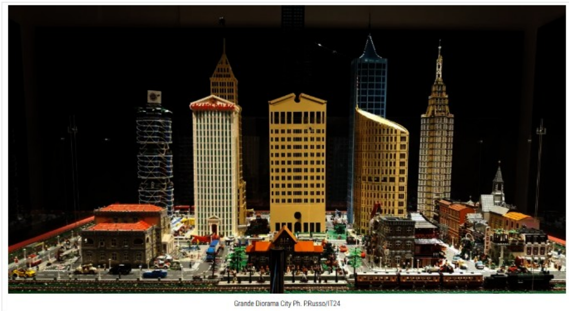
Grande Diorama City

Dal 27 gennaio 2021 , al PALP – Palazzo Pretorio – di Pontedera (Pisa) sarà possibile visitare la mostra I Love Lego , pensata per sognare, divertirsi e riscoprire il lato ludico e creativo scrutando tra i dettagli di interi mondi in miniatura. La mostra è un'occasione imperdibile per tutti gli appassionati, per le famiglie e per i più piccoli, che potranno passare una giornata da protagonisti in un'atmosfera magica e divertente che ha come protagonista quei mattoncini "prodigiosi" che ogni anno fanno giocare oltre 100 milioni di persone.