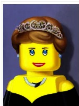
Lady D_Olio di Stefano Bolcato

Le sale del piano superiore del PALP ospitano sei diorami ( Classic Space – Grande Diorama City – Roma e i fori imperiali – Il foro di Nerva – Pirati – Nido dell'aquila – Grande diorama Castello – Porto ) interamente realizzati con oltre 1 milione di di mattoncini LEGO® e dodici oli ispirati a grandi capolavori della storia dell'arte reinterpretati e trasformati in "uomini lego" dall'artista contemporaneo Stefano Bolcato . L'artista unendo la sua passione per i LEGO e la sua arte – attraverso una tecnica pittorica ad olio – ha creato forme di assemblaggio ispirate in particolar modo dal "magnetismo" dei ritratti rinascimentali.